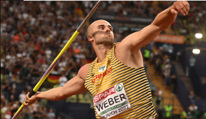
Julian Weber, Leichtathletik/ Speerwurf Europameister 2022

» Ich möchte der Sporthilfe für die langjährige Unterstützung danken und alles, was sie für uns Sportler:innen macht. Dabei geht es nicht nur um die finanzielle Unterstützung, sondern auch um die gesamtheitliche Betreuung und Förderung von Athlet:innen.